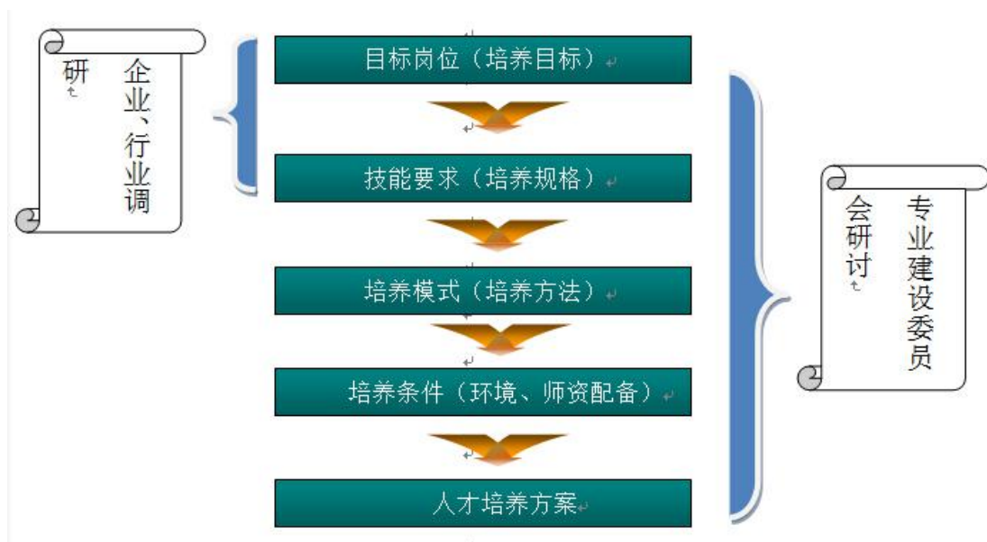
图一 人才培养方案建设过程图

本专业通过行业交流、专业建设委员会专题讨论、企业交流与问卷调查等方式对计算机网络技术人才岗位群、岗位技能、典型项目等多方面进行调研。在多方调研的基础上，制定计算机网络技术专业的人才培养方案、课程标准、教学大纲和教学计划。