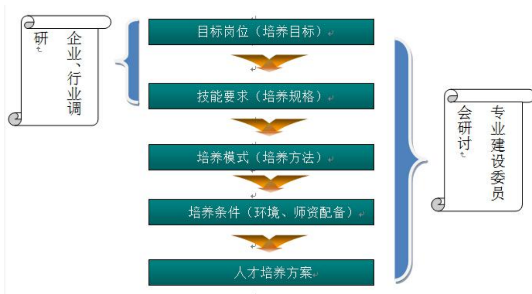
图一 人才培养方案建设过程图

计算机应用专业通过行业交流、专业建设委员会专题讨论、企业交流与问卷调查等方式对计算机应用人才岗位群、岗位技能、典型项目等多方面进行调研。在多方调研的基础上，制定本专业的人才培养方案、课程标准、教学大纲和教学计划。