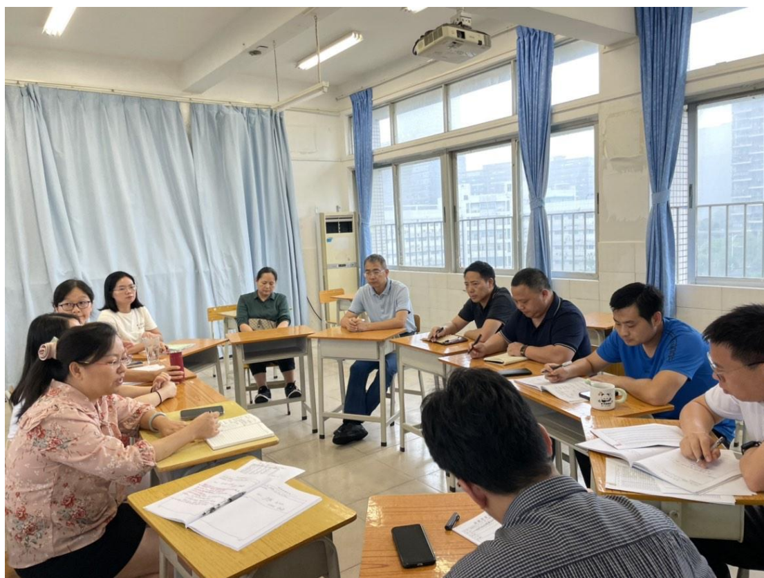
编写组第二次会议

与会成员就教材撰写的具体内容调整和注意事项方面进行了详细讨论并给出了建议，指出教材编写要从实用性出发，注重规范参考文献撰写、编排内容详略分配等；同时，教材也要注重融入课程思政内容。