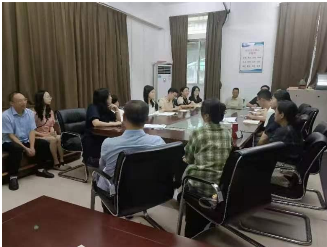
编写组第三次会议