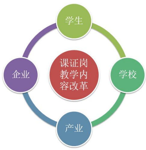
图二 “多元协同、课证岗融通” 改革