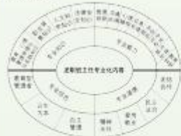
图1 龙职班主任专业化内容

班主任队伍专业化发展的主要内容共分为“专业信念”“专业道德”“专业知识”“专业能力”四个模块,四大模块又细分为“教育型管理者”“以生为本”“自主管理”“精神关怀”“爱岗敬业”“民主法治”等19项内容(如图1所示)。